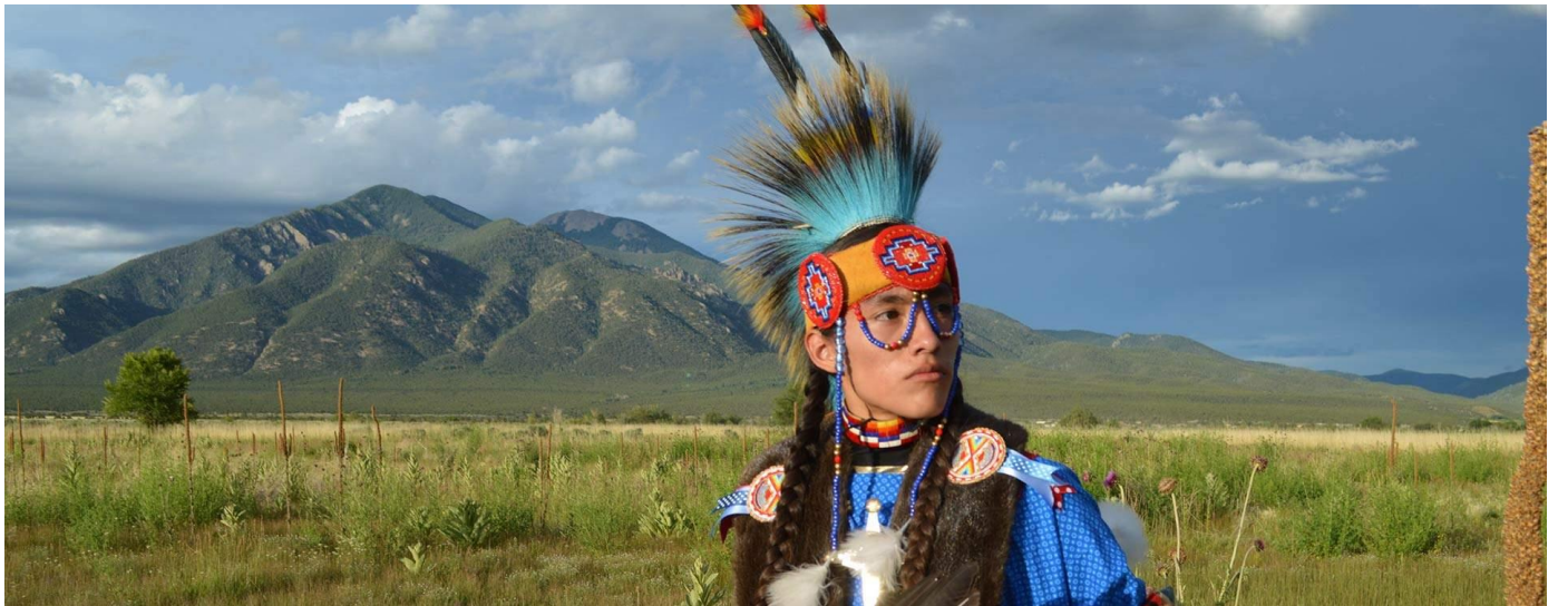
Una bailarina se presenta en el Mercado Indio de Santa Fe.